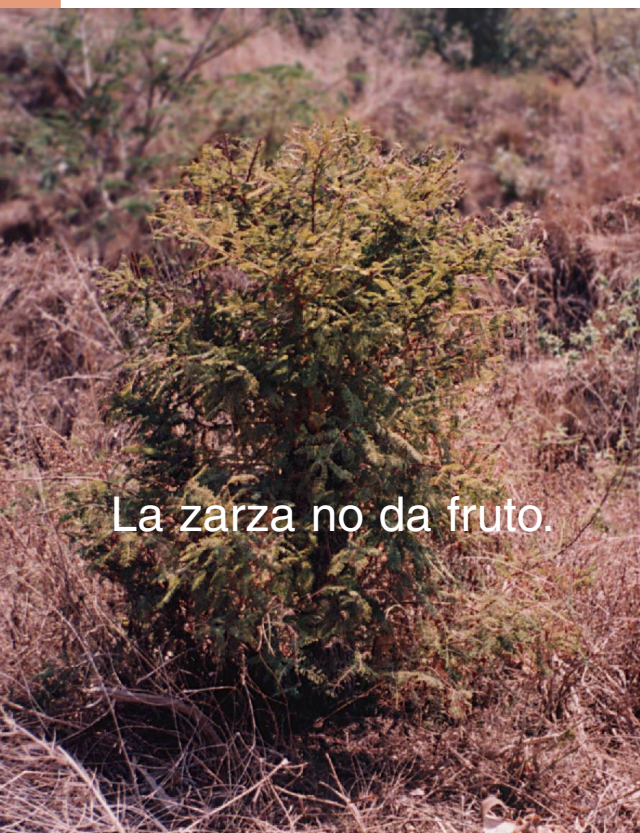
La zarza no da fruto.

Dios le dijo a Moisés de un plan que El tenía para sacar a su pueblo de Egipto y llevarlo a una tierra buena que fluía leche y