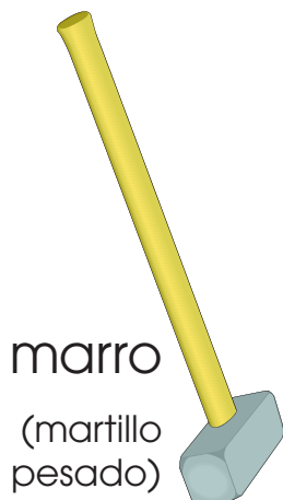
marro (martillo pesado)

Explique que cada cosa empieza con el sonido "m".